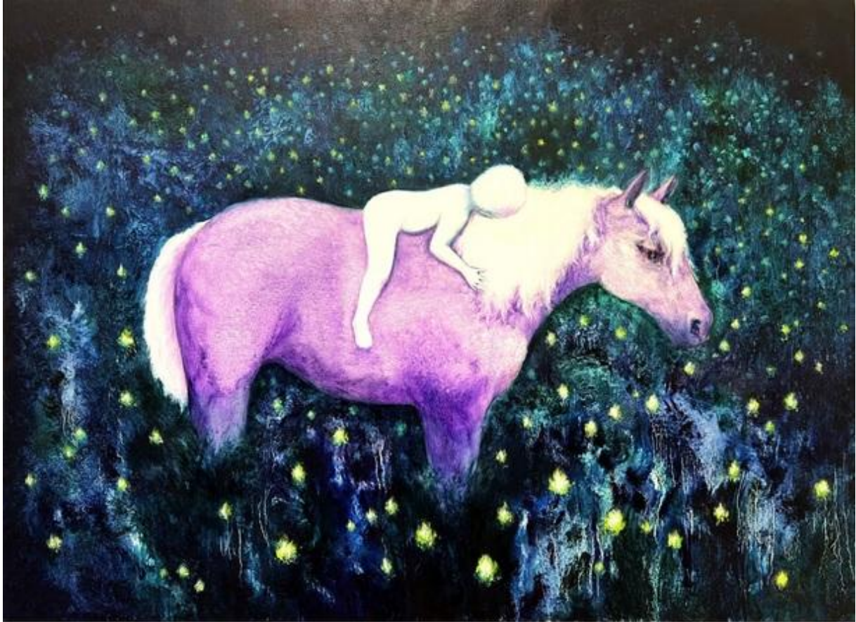
Suivre mon rêve comme un cheval 2024,